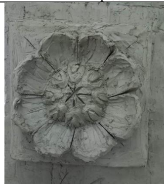
Тема 1.5. Копия гипсовой розетки или рельефа