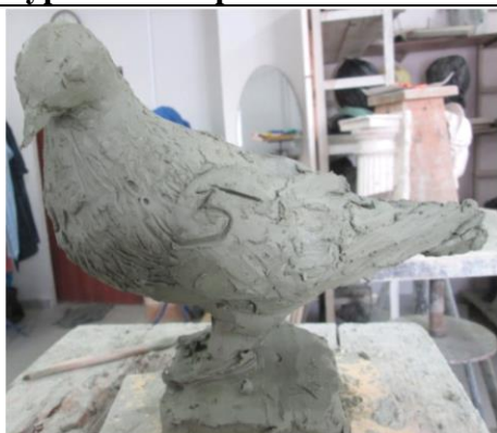
Тема 2.2.Пластическое изображение птиц.