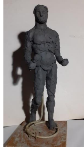
2.4.2. Анатомическая фигура