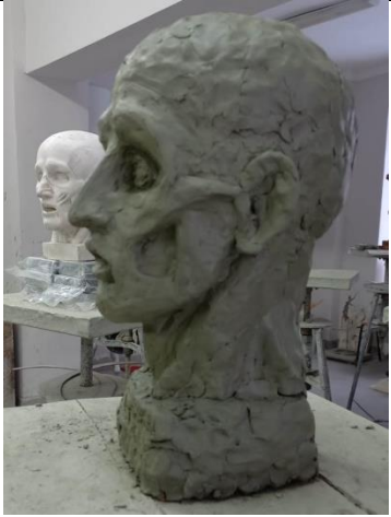
2.4.1 Анатомическая голова