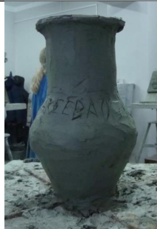
Тема 1.3. Лепка предметов быта