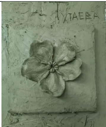
Тема 1.6 Скульптурное изображение цветка (растения) с натуры