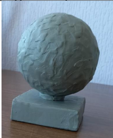
Тема 1.2. Лепка отдельного геометрического тела