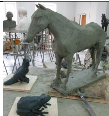
Тема 2.3.Пластическое изображение животного.