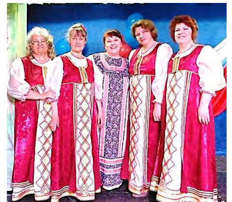
Выступление в Доме культуры (2019 г.)