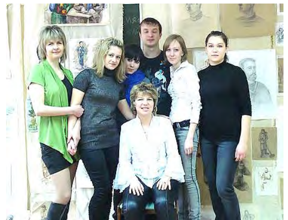
На просмотре (2011 г.)