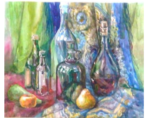
Работы И.А. Безиной