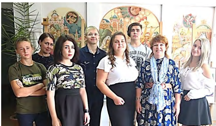
С выпускниками (2019 г.)