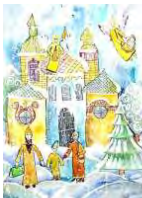
1 место, Таисия Давыдова, 10 лет, БОУ ДО г.Омска «ГДДют».