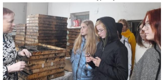
В цехе лакировки полуфабриката