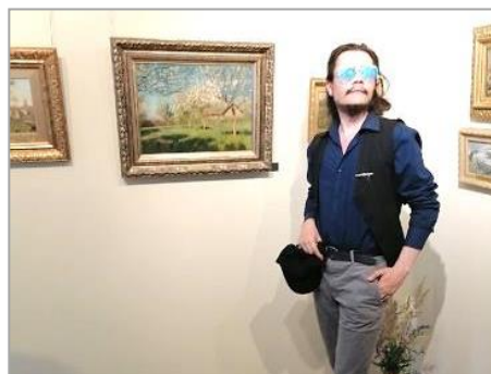
В доме-музее И.И. Левитана