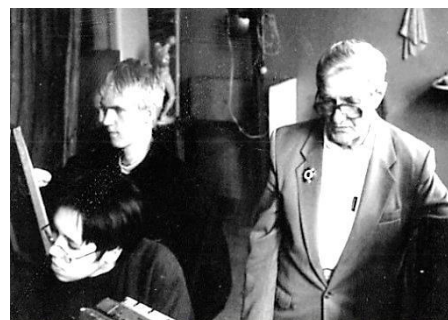
На учебных занятиях