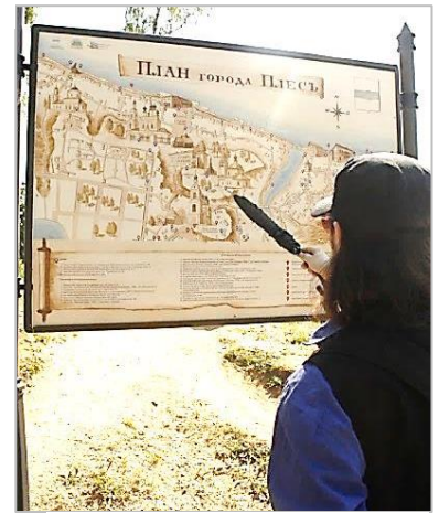
Горд Плес на Волге