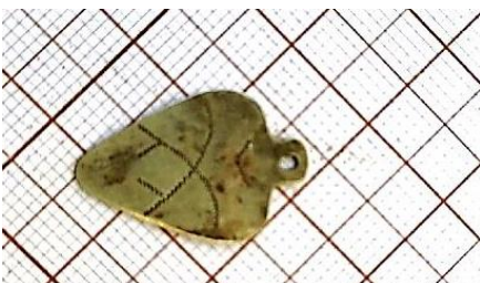
Археологические находки. Фрагмент кольца.