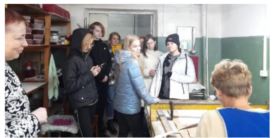
Цех изготовления футляров