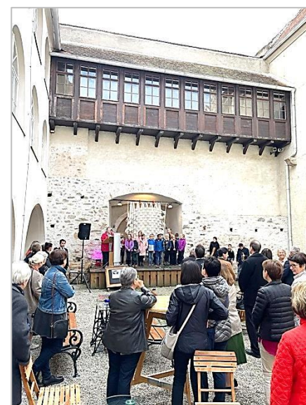
Церемония открытия конгресса