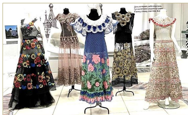
Выпускные квалификационные работы студентов Высшей школы народных искусств (академии)